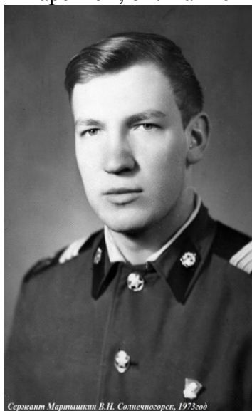
(Автор статьи, 1973 год.)