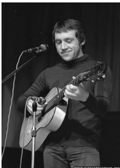
(В.С. Высоцкий в Казани, октябрь 1977 г.)