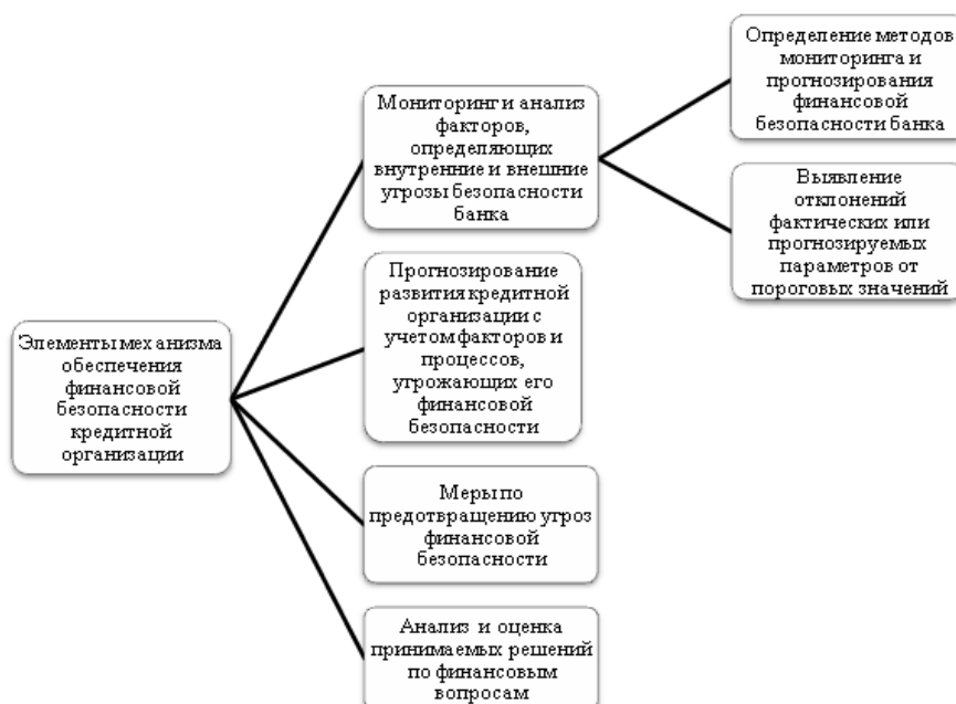
Рисунок 1 - Составляющие механизма обеспечения финансовой безопасности кредитной организации

Обеспечение собственной безопасности является одним из постоянных направлений деятельности любого банка, поскольку это является неотъемлемым условием его существования. В частности, финансовая составляющая экономической безопасности коммерческого банка определяется как основа его существования и залог успешной и стабильной работы, она представлена основными элементами ее механизма (Рис. 1).