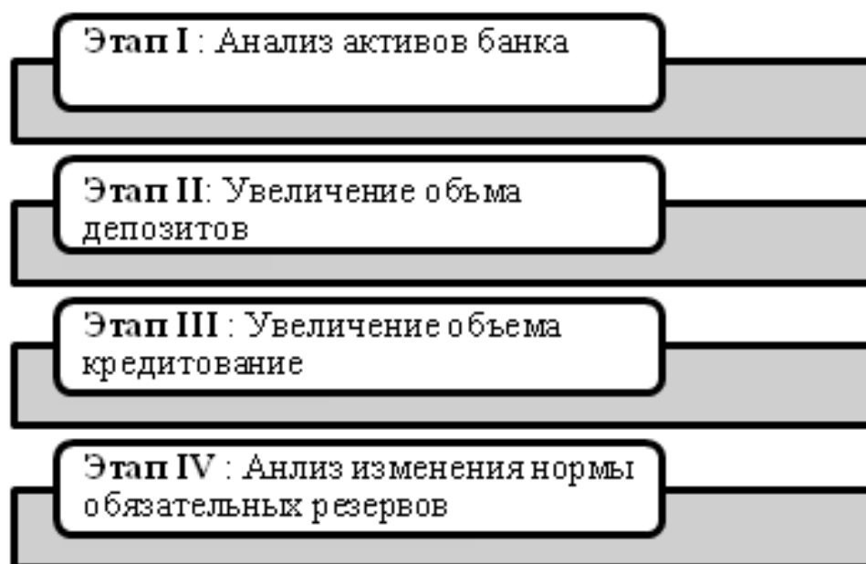
Рисунок 4 – Этапы механизма обеспечения финансовой безопасности банка

Таким образом, предложены следующие этапы механизма обеспечения финансовой безопасности, которые представлены на рисунке (Рис. 4).