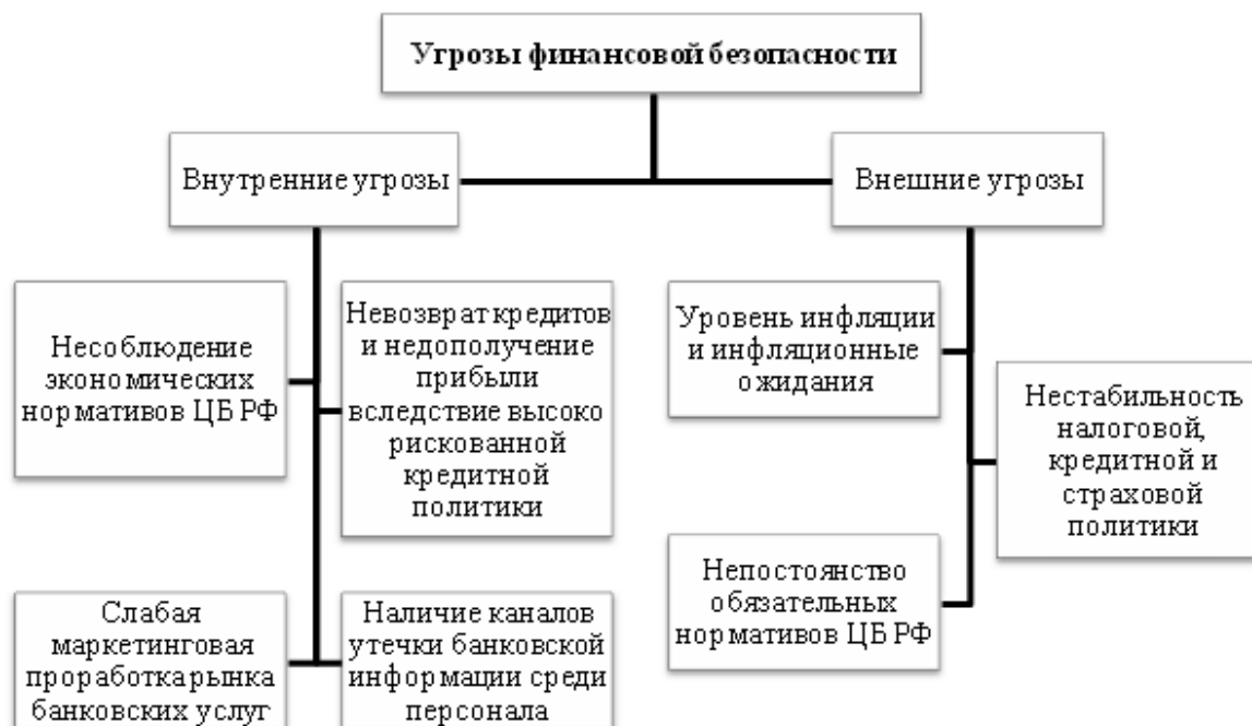
Рисунок 2 - Классификация угроз финансовой безопасности кредитной организации

Проявлений угроз финансового характера существует множество, распространенной является систематизация угроз на внутренние и внешние (рис.2).