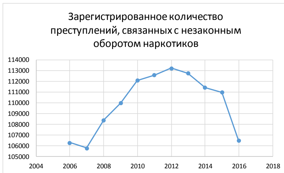
Показатели преступлений, связанных с незаконным оборотом наркотиков в России за 2006-2016 г.