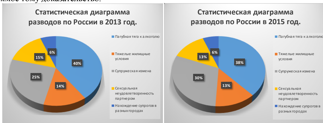
Статистика разводов в России за 2013 г.

Вторым образцом, иллюстрирующим губительность влияния, оказываемого современной медиа средой, является телесериал «измены», так же детище вышеобозначенной телесети ТНТ. Итак, кратко пробежимся по особенностям сюжетной линии данной картины. Хотелось бы начать с того, что это законченная история, состоящая всего из одного сезона, идеализирующая своей направленностью образ всех женщины легкого поведения, которые, якобы, запутались в собственной противоречивой модели жизненного поведения и при этом, все же не спешащие свернуть с выбранного ими пути. Чтобы было понятнее, лейтмотивом киноленты выступает тема измены, но не как отрицательного социального феномена, а скорее, как обыкновенной черты природы человека. Возможно думающий зритель и понял бы всю соль и ироничность такой идеи, но как показывает опыт, большинство людей, тратящих свою жизнь на просмотр телесериалов, самостоятельно думать уже не способны, а только копировать образы, которые им пытаются впихнуть современные представители теле индустрии. И вот вам прямое тому доказательство.