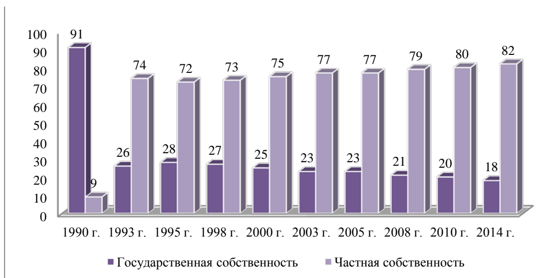
Рис. 1 Динамика соотношения государственной и частной форм собственности в РФ, в % к общему числу

Сравнивая долю государственных российских компаний и организаций (рис. 1) в национальной экономике в различные исторические периоды и на современном этапе, можно заметить тенденцию к снижению абсолютного количества таких предприятий, однако начиная с 2000-х годов темпы сокращения все же значительно снизились.