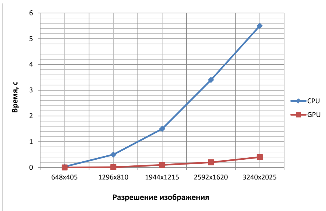
Рисунок 1. График зависимости времени выполнения морфологической фильтрации от разрешения изображения с использованием вычислений на CPU и GPU.