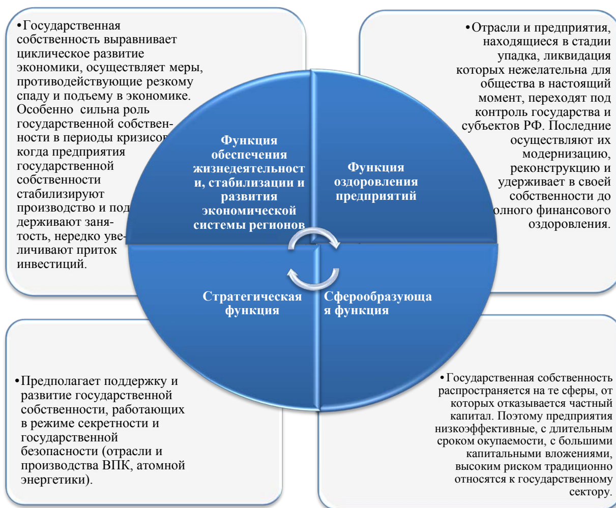
Рис. 2 Функции государственной собственности, характеризующие направления ее воздействия на экономическое развитие регионов

Опираясь на вышесказанное, можно выделить основные функции государственной собственности , характеризующие направления ее воздействия на экономическое развитие регионов (рис. 2).